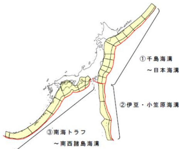
解説図 1 プレート間地震に起因する津波波源の対象領域